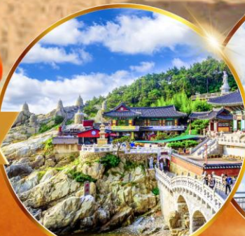
วัดแฮดยงกุงซา