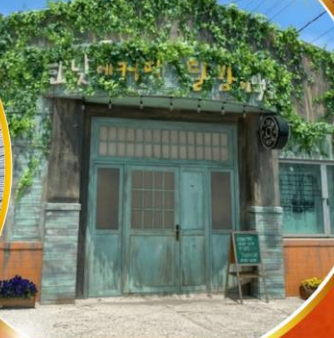
ตามรอยซีรีส์ดัง Hometown chachacha

โพฮังสเปซวอล์ค สกายวอร์ค ตามรอยซีรีส์ Hometown chachacha ถ่ายรูปชิคๆ หมู่บ้านวัฒนธรรมคิมซอน ขึ้นเคเบิลคาร์ ชมทะเลปูซาน นั่งรถไฟปู๊กปิ๊ก sky capsule ชิมของอร่อยตลาดแฮอนแด แหล่งช้อปปิ้งใต้ดิน ชัมยอน อิสระช้อปปิ้ง Lotte Duty Free