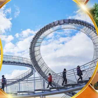
โพฮังสเปซวอล์ค